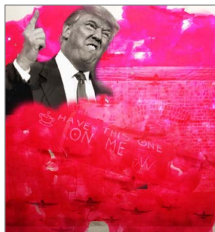
Eksempel på elevarbeid, DKS 2017