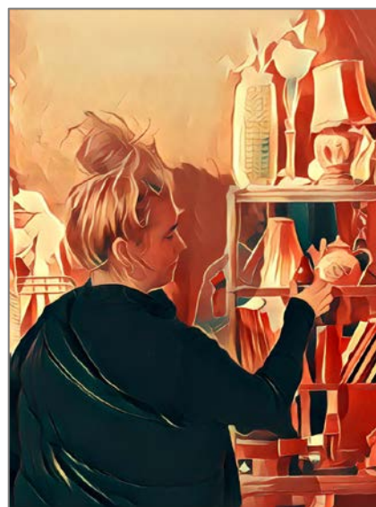
Eksempel på elevarbeid, DKS 2017

Elevene skal også gi sitt bilde en tittel og bildet skal lastes opp på egen Facebook-side tilknyttet opplegget og gjennomgås i plenum.